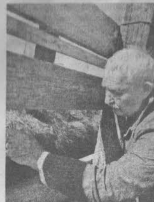
Уважением жителей Саркеловского сельского поселения

базе автомобиля УАЗ для проведения ветеринарных обработок скота, в том числе против клещей, особенно досаждающих в